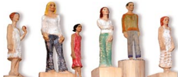
Bildmotiv: Michael Pickl/Bildhauer